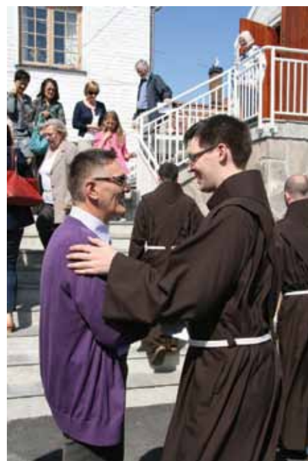
Gratulantene sto i kø på kirkebakken.

– Har du noe å si til ungdom i dag som kanskje vurderer å gå i kloster?