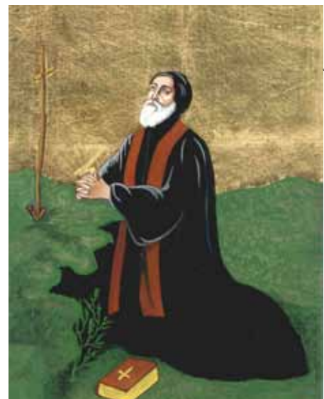
Maronittene har sitt navn etter Den hellige Maron.

Så fremstiller de også spontant Kirkens Herre som sårbar og liten i sin Mors favn, ikke som noen tronende Pantokrator. Dragningen mot den gravlagte, lørdagens Kristus peker i samme retning. Kontinuiteten med evangeliske forhold har også en språklig dimensjon. Da det greske språk ble satt til å tjene kristen bønn og forkynnelse, hadde det allerede gitt uttrykk til noen av de vakreste, mest opphøyde tanker mennesker noensinne har tenkt. Latinen var på lignende vis (men på andre premisser) blitt til et rikt, slagkraftig lingvistisk redskap. Syrisk, derimot, hadde ingen lang skriftradisjon. Språkets rikdom lå i instinktenes og elementenes ord, i ord for menneskelig erfaring som ikke var tenkt for opptegnelse, men for ærverdig gjentelling gjennom søvnløse netter. Selve morsmålet ble en tilflukt for maronittiske kristne, et åndelig skjulested hvor hjertet kom i tale. Vi finner flere steder ved deres egenart uttrykt i en bønn