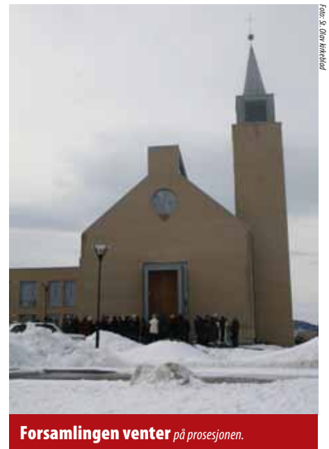
Forsamlingen venter på prosesjonen.

Våre birgittasøstre har satt alle sine krefter og midler inn for akkurat dette. Jeg har vært deres gjest i Stockholm, Tallin, Jerusalem og – Tiller. Jeg vet jeg kan reise mange andre steder, og der vil også deres gjestfrihet komme meg til gode. De sørger ikke bare for at jeg kan delta i messe og tidebønn, men også for meg som menneske: mat, hvile, omsorg, oppmuntring. De spør ikke etter trosbekjennelse, men det er ingen tvil om at de lever i sin, i vår. Mange har grunn til å si: Jeg var fremmed, og dere tok imot meg.