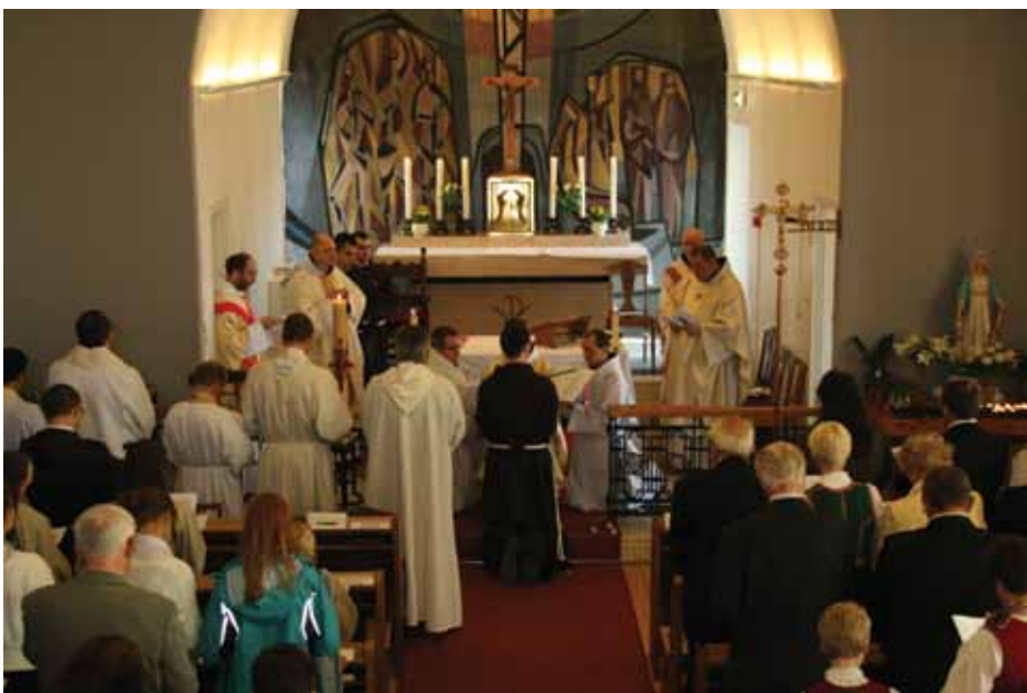
Kandidaten avlegger løftene knelende.