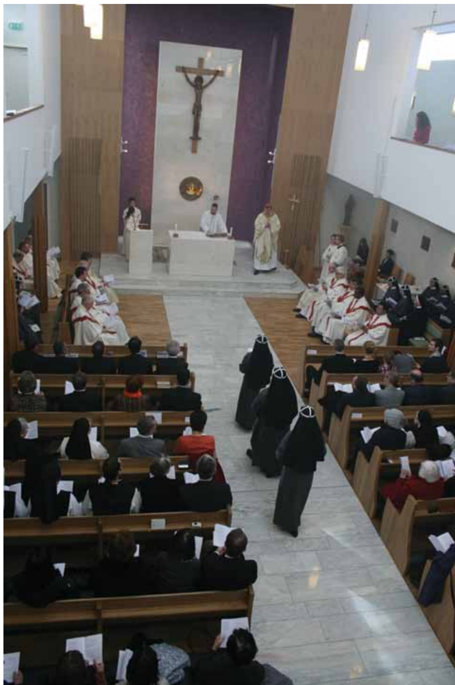
Kirkerommet sett fra galleriet.

Etter den verdige seremonien ble det lest opp et gratulasjonstelegram fra Den hellige far, som fremhevet Birgittas rolle som mor, kontemplativ og grunnlegger, og hennes kirkelige og politiske betydning. «I sin grunnleggers fotspor vender birgittasøstrene