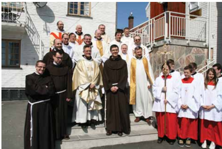
Noen av de fremmøtte etter messen

hva det ville si å leve som munk. Jeg var ikke lenger bare en vanlig katolsk gutt, jeg var nå munk, også i det ytre.