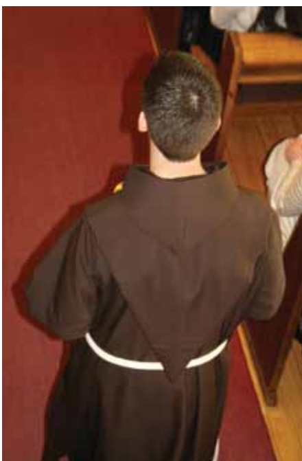
Offergavene bæres frem.