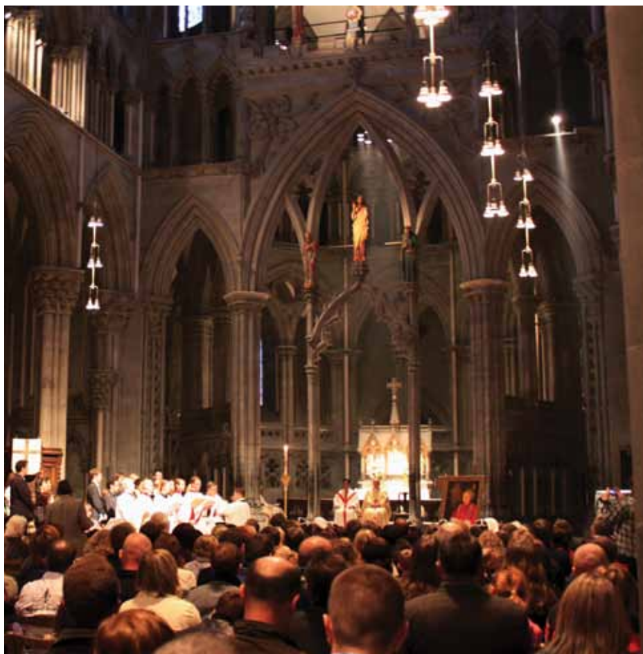
Feiring i Nidarosdomen

Et siste eksempel: Den unge Karol Wojtyla følte tidlig kallet til et kontemplativt liv i stille bønn. Han studerte 1500-tallets store mystiker Johannes av Korset og skrev senere en doktoravhandling om ham. Som nyviglet prest bad han erkebiskopen av Kraków om tillatelse til å tre inn i den kontemplative karmelittordenen, men fikk avslag. Gud og Kirken hadde andre planer