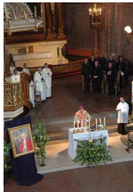
Feiring i Trefoldighetskirken, Oslo

Som ung drog han på lange skiturer, fartet i fjellet, padlet milevis i kajakk på polske elver. Utfartstrangen sitter ham fortsatt i blodet etter pavevalget. Han foretar 102 reiser, tilbakelegger en strekning som svarer til 28 ganger jorden rundt. Utfartstrangen fra unge år lever videre i ham som pave, men foredles. Nå reiser han for å nå men-